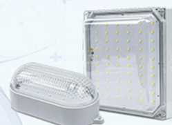
۴- روشنایی سردخانه