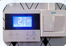
۷- پنل های کنترلی سردخانه

سردخانه صنعتی یک سیستم پیچیده است که برای حفظ دما و شرایط محیطی مناسب جهت نگهداری مواد غذایی، دارویی و محصولات حساس به دما طراحی شده است.