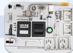
۶- قفل نگهداری درب سردخانه