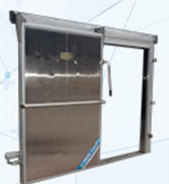
۵- درب سردخانه