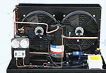
۲- کندانسینگ یونیت